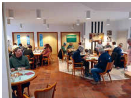
Mittagessen Himmel & Erde

Kaffee, Spiele, Geschichten... Donnerstags 15:00 bis 16:30 Uhr Im Martin-Luther-Haus, Kirchplatz 5